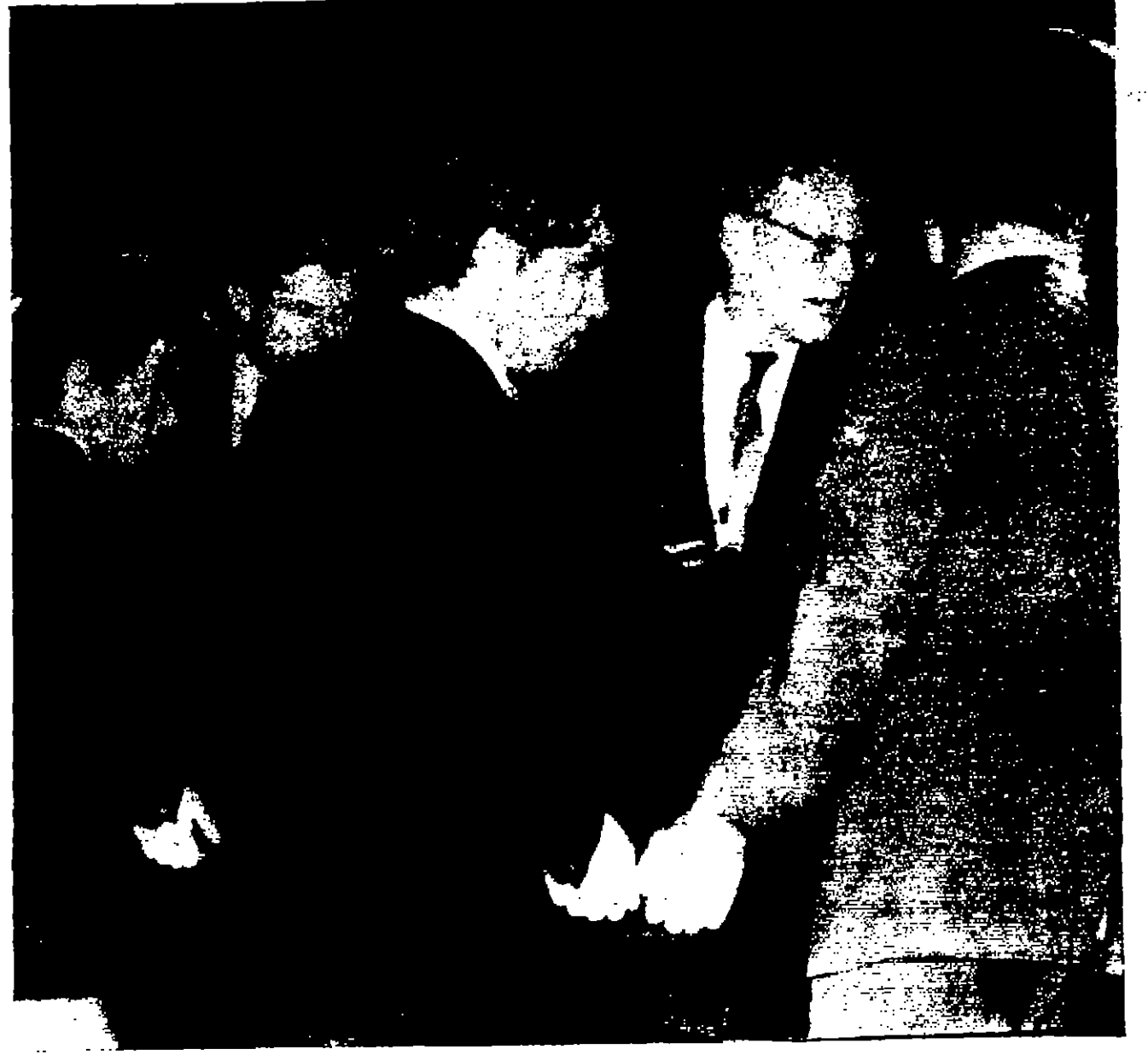
جلمان السناتور روبرت كينيدي في مطار كاتدرائية في نيويورك قبل نقله إلى واشنطن

واشنطن - رويتر - أعلنت الولايات المتحدة الحداد رسمياً أمس على السناتور روبرت كينيدي الذي دُفِن ليلة أمس الأول في الجانب شقيقه الرئيس الراحل جون كينيدي تحت وهج المصابيح الكاشفة ومشاعل المسبحين وضوء القمر. وكان الرئيس جونسون قد دعا الأميركيين إلى «حلم الصلوة» من أجل هذه الليلة القاتمة من الآلام وبدا نحو فجر جديد من الوحدة الوطنية. والتفتت الكوارث تلاحق العائلة كينيدي في الأيام موكب الحزن فقد قتل شخصان أثناء رحلة القطار اللص الذي نقل عائلة كينيدي وجثمان السناتور الراحل والخبير من نيويورك إلى واشنطن. وقتل الشخصان وهما رجلان وامرأة في محطة الترامبولين بولاية نيويورك عندما ابتعدوا مسرعاً على الخط بغير إيداع مكان ينطبق منه القطار نظراً لفضول القطر الذي يحتمل ضمان السناتور كينيدي. وقد أصحبه بها قطار كان منطلقاً في الاتجاه العكسي وقتها - وأصيب شاب بأصابة بالغة عندما تساقط ظهر قطار الفتح ولم يربطها كورتيها ذا بونر مل. واستمرت رحلة القطار من نيويورك إلى واشنطن ثم في ساعات بدلا من أربع ساعات كما كان مقرراً.